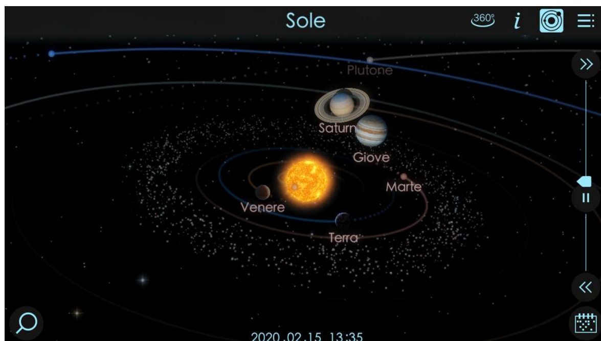
Fig. 1 - Il Sistema Solare al 15.02.2020 (simulazione), con Saturno e Giove che si stanno congiungendo.